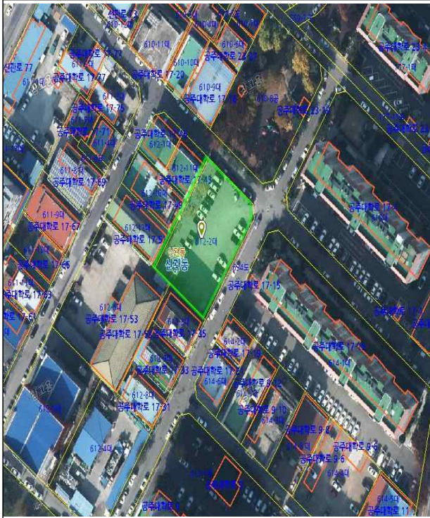
신관동 612-2번지(현대1차아파트 옆) 위치도