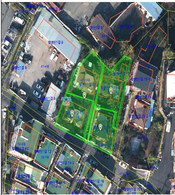
옥룡동 47-10 번지 외 3필지(대웅맨션) 위치도